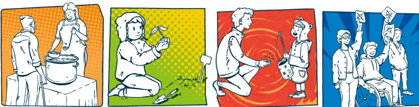
Ehrenamt prägt das Gesicht der Pfarrei — Projektarbeit und Kooperationen stärken Beteiligung vor Ort.

Zunehmend wird die Abkehr von der „Volkskirche“ zu einer „Kirche im Volk“ sichtbar, was auch komplett neue Herausforderungen mit sich bringt. Dabei findet vieles nicht gleichzeitig statt. In manchen Großstädten sind Christinnen und Christen (nicht nur Katholikinnen und Katholiken) schon in der Minderheit, in manchen ländlichen Gemeinden ist die Welt noch (scheinbar) in Ordnung. Wenn etwas nicht mehr selbstverständlich ist, braucht es viel mehr Erklärungen nach dem „Warum“. Dies gilt natürlich für den Glauben und das allgemeine kirchliche Engagement, aber noch mehr für den Pfarrgemeinderat (PGR), der von Außenstehenden gerne als „Abnickgremium“ oder „Aktivkreis“ gesehen wird. Innerkirchlich stellt er ein synodales Gremium dar. Er bringt das gemeinsame Unterwegssein aller Gläubigen, Amtsträger wie Laien, zum Ausdruck, das im gemeinsamen Priestertum aller Gläubigen seine Grundlage hat. Ein kluger Pfarrer wird auf „seinen“ PGR hören und kluge Pfarrgemeinderätinnen und Pfarrgemeinderäte werden die Anregungen des Pfarrers aufnehmen, wenn sie aktiv werden. Gerade dieses gute Miteinander – und nicht Gegeneinander – wird dann attraktiv