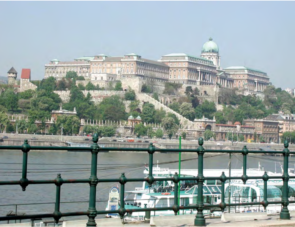
Nach der Grenzöffnung im Jahr 1989 begann der lange unterdrückte Katholizismus in Ungarn wieder aufzublühen (Ansicht von Budapest).