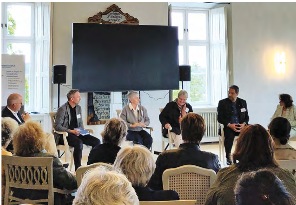
Die „hinüber-Manufaktur“ im Kloster Beuerberg war mit 80 Teilnehmenden aus verschiedenen Diözesen und Konfessionen ausgebucht.