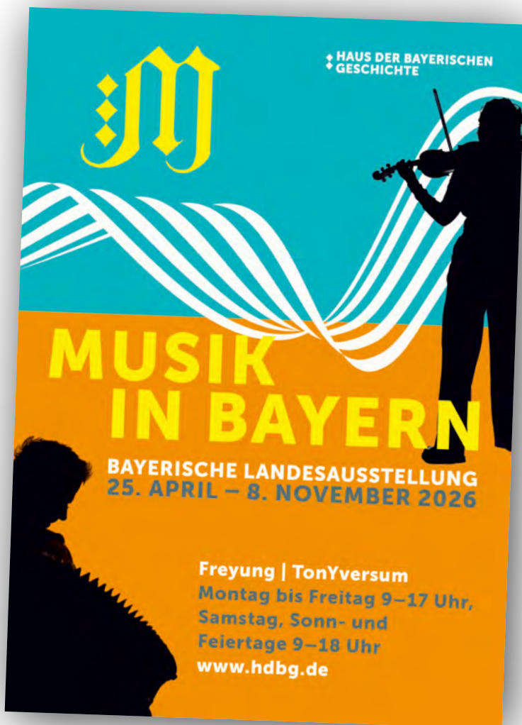
Plakatmotiv zur Bayerischen Landesausstellung 2026 Musik in Bayern, Gestaltung: wir sind artisten.

schichte, eine Einrichtung des Bayerischen Staatsministeriums für Wissenschaft und Kunst. Das Haus ist seit vielen Jahren für die Organisation der Bayerischen Landesausstellungen verantwortlich und entwickelt diese zusammen mit regionalen Partnern. Die Stadt Freyung übernimmt als Projektpartner unter anderem die Organisation von Begleitprogrammen.