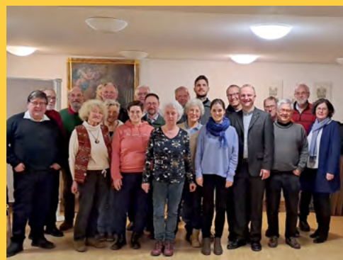
„Synodal-in-Augsburg“-Treffen im Januar 2025.

„Synodal-in-Augsburg“, eine Initiativgruppe aus Mitgliedern von reformorientierten Gruppierungen und Einzelpersonen, hat sich zusammengefunden, um Anregungen, die in der „Synode 2021-2024 – für eine synodale Kirche“ an die Kirchenbasis gerichtet wurden, aufzugreifen und zu leben.