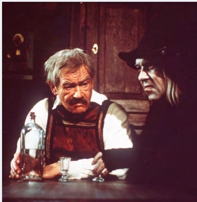
An seinem 70. Geburtstag wird der Tod (Boandlkramer) den Brandner Kasper ins Paradies holen. Der gewitzte Jäger weiß aber den ungebetenen Gast zu überlisten.

Kurz: Franz von Kobell erschafft mit seinem Kasper einen listigen, warmherzigen bayerischen Mann, der dem Tod nicht kampflös weicht. Mit einer Mischung aus Humor, Gemütlichkeit und Cleverness entführt er den Tod in ein Kartenspiel, gewinnt Zeit und schließlich einen Blick ins Paradies. Doch statt zur Erde zurückzukehren, bleibt Kasper – von der himmlischen Versöhnung