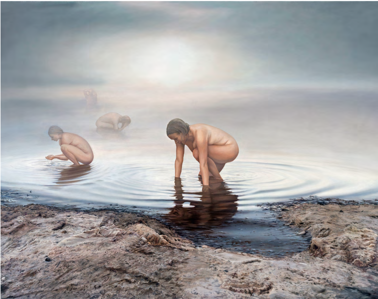
Brigitte Stenzel, Purgatorium, 2024. Öl auf Leinwand, 140x190 cm.

ves Spiel von Licht und Spiegelungen. Die Menschen sind nackt und ungeschützt. Sie müssen nichts mehr verhüllen. Eine Gestalt blickt ins Wasser, nicht eitel wie Narziss, sondern schmerzlich offen für die Wahrheit über sich selbst. Es ist das delphische „Erkenne dich selbst“ in einer radikalen, existenziellen Dimension. Reinigung geschieht hier im Inneren, in einem stillen Prozess, der weder von äußeren Flammen noch von schrillen Schreien begleitet wird.