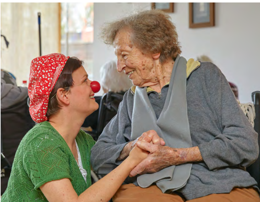
Begegnungen wie diese zeigen: Auch am Lebensende bleibt Platz für Wünsche, kindliche Neugier und das Staunen über das, was kommt – begleitet von Clowns, die sich auf das Sterben einlassen.

So manche Seniorinnen und Senioren haben wir schon getröstet müssen: „Der himmlische Immobilienmarkt ist gerade ziemlich ausgelastet – kein Wölkchen mehr frei, Sie