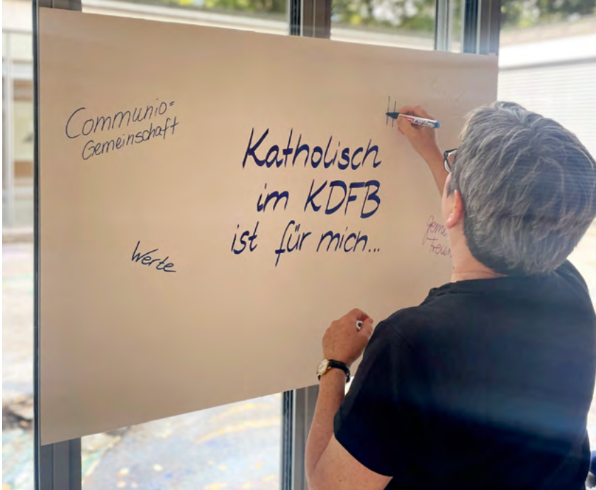
Ein KDFB-Mitglied schreibt die persönlichen Gedanken zu „Katholisch im KDFB ist für mich...“ auf eine Wortwolke.

bereits ausgetreten. 3 Prozent gehören einer anderen Konfession an. 87 Prozent sind und bleiben Mitglied der römisch-katholischen Kirche. Der KDFB stellt sich damit deutlich gegen den gesellschaftlichen Trend der Abkehr von der Konfession. Neueste Zahlen zeigen: Erstmals gehören in Deutschland mehr Menschen keiner Religionsgemeinschaft an als den beiden großen Kirchen. 39 Millionen Menschen sind konfessionslos, 38 Millionen katholisch oder evangelisch. Zum Vergleich: Waren 1990 nur 22 Prozent konfessionslos, sind es heute 45 Prozent.