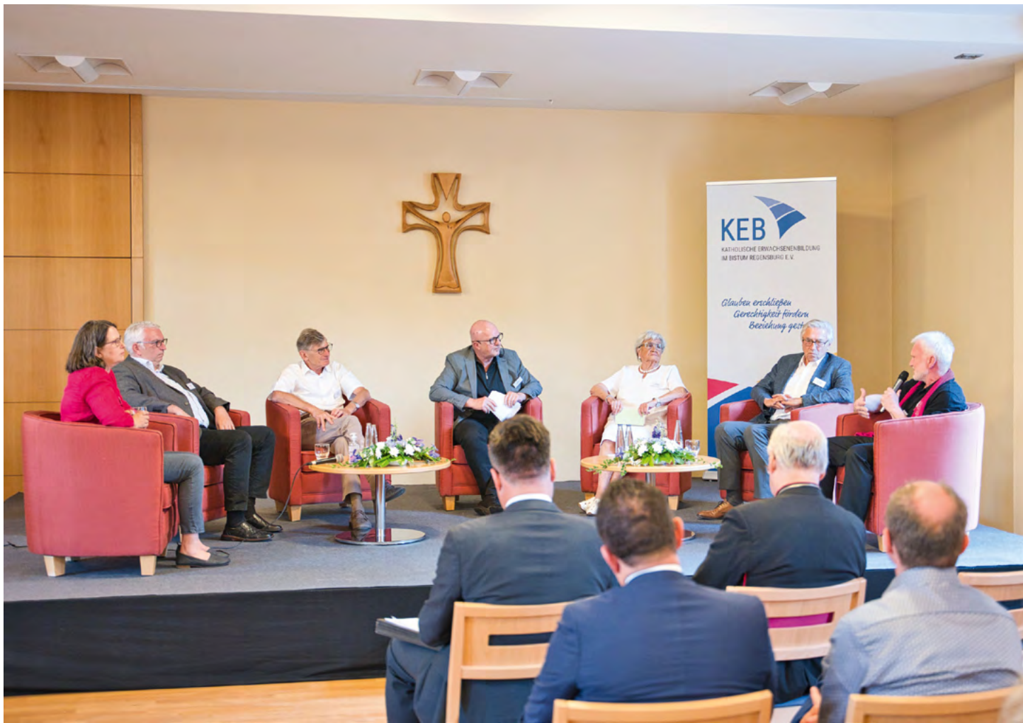
Veranstaltungen zu besuchen, bei denen offen über Glaubensüberzeugungen geredet wird, kann Mut machen, am Rande selbst darüber zu reden.

gewohnt? Oder bewegt uns der Glaube nicht wirklich?