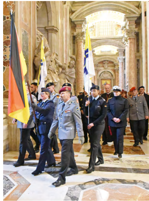
An der Engelsburg startend, zogen die Soldatinnen und Soldaten und ihre Angehörigen gemeinsam mit dem Militärbischof, Kreuz und Fahne der Militärseelsorge vorneweg, über den Petersplatz durch die nur alle 25 Jahre geöffnete Heilige Pforte in den Petersdom ein.

Sie hat mir erzählt, dass sie sich für den Ethikunterricht entschieden hat, weil sie mit Religion nichts anfangen kann. Sie findet, man kann auch ohne Gott ein anständiges Leben führen. Das erfährt sie regelmäßig in