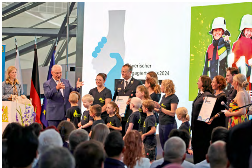
Viele weitere Institutionen würdigen das Ehrenamt mit verschiedenen Preisen, wie zum Beispiel das Bayerische Staatsministerium des Innern, für Sport und Integration mit dem „Engagiert-Preis“.