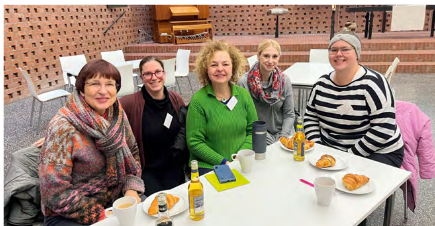
Hauptamtliche haben nicht die Ressourcen, die Ehrenamtlichen einmal im Jahr zum Gespräch einzuladen. Deshalb kam die Idee, Ehrenamtsteams einzusetzen.