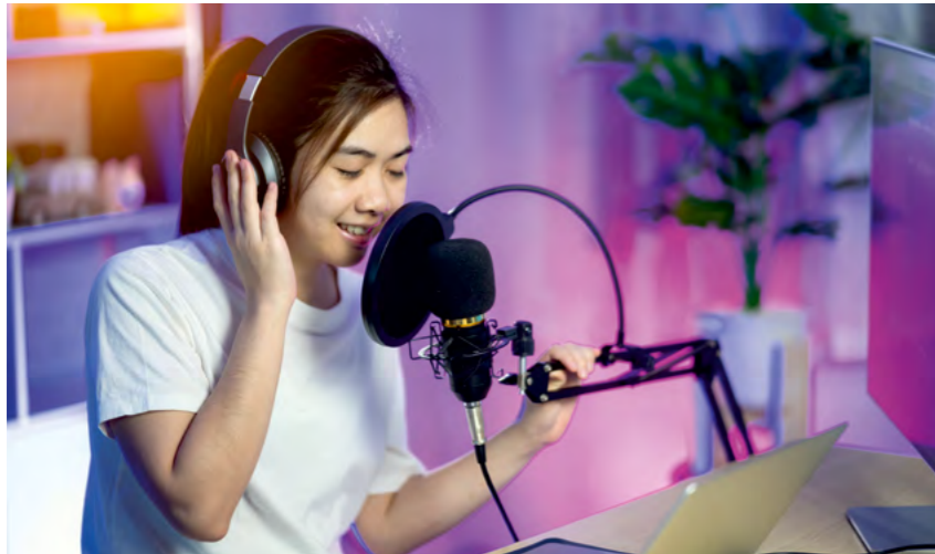
Ein Mikro, ein Laptop, ein Rucksack. Beatbag ermöglicht Kindern und Jugendlichen ihre ersten professionellen Aufnahmen.