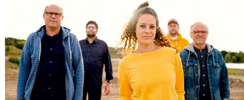
Als christliche Band legt Sternallee nicht nur Wert auf schöne Musik, sondern ebenso auf die Botschaft ihrer Lieder.