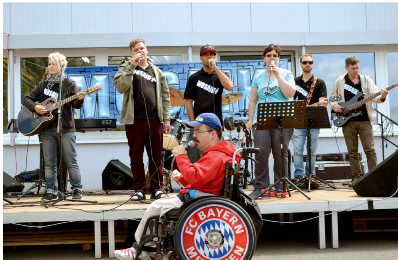
„Mosaik“ bei einem seiner zahlreichen Auftritte in Würzburg.