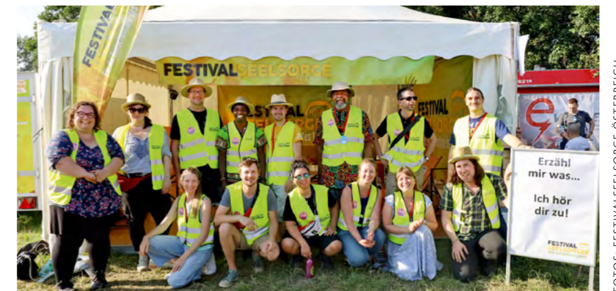
Waren sie damals noch rudimentär ausgestattet, mit einem kleinen Tipi und einfachen Sitzmöglichkeiten, das meiste aus privatem oder pfarrlichem Inventar, hat sich das Equipment als auch der Auftritt Jahr für Jahr weiterentwickelt.

Festivalseelsorge bietet am Festival eine fixe Anlaufstelle und ist auch auf dem Gelände unterwegs und ansprechbar. Der fixe Standort ist mit Liegestühlen ausgestattet – eine Atmosphäre zum Runterkommen, Entspannen und Plaudern. Unterwegs auf dem Festivalgelände, vor den Bühnen und am Campingplatz ist das geschulte Team in Zweiertteams unterwegs. Erreichbar sind die Festivalseelsorgenden rund um die Uhr – entweder in Präsenz oder über das Notfalltelefon, gearbeitet wird in Schichten, teils bis in die Nacht hinein.