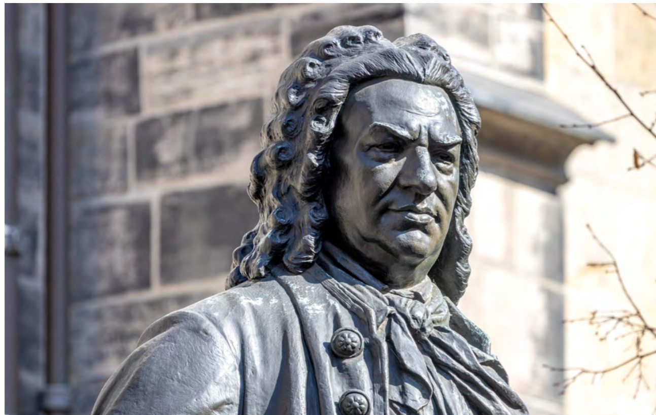
Johann Sebastian Bach gilt als der „Mathematiker“ unter den Komponisten – von den Naturwissenschaften über die Musik zur Religion. Musik hat hier jedoch Grenzen.