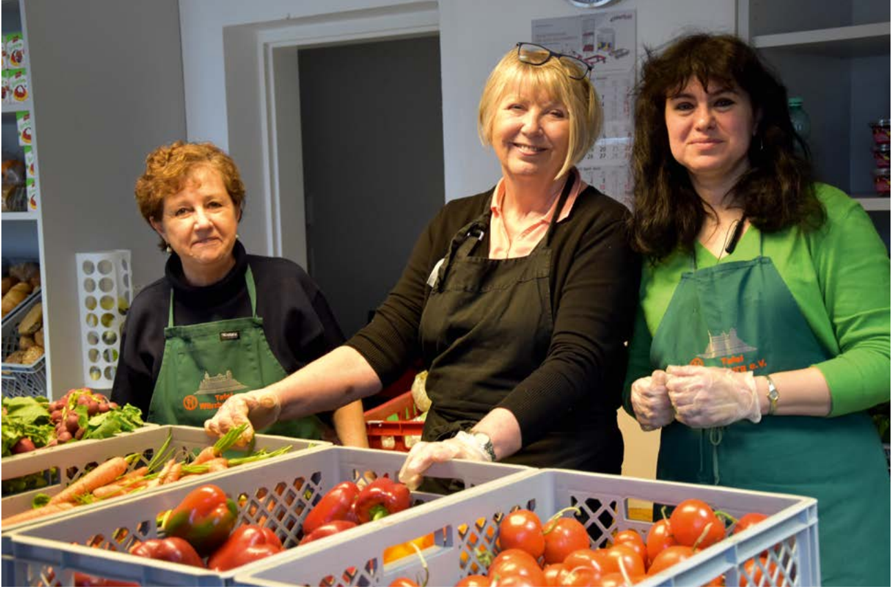
Ehrenamtliche helfen bei der Würzburger Tafel Menschen in prekären Lebenslagen.