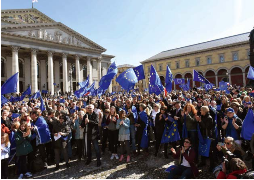
Blaue Fahnen, wohin das Auge sieht. Jeden ersten Sonntag im Monat gehen in vielen Städten Menschen mit Europafahnen auf die Straßen und bekennen ihr klares „Ja“ zu Europa. Organisiert werden die friedlichen Demonstrationen von Pulse of Europe.

der ist eingeladen, seine Gedanken, Wünsche, Forderungen und Zweifel zu Europa zu artikulieren. Wir hören uns zu und suchen nach dem, was eine neue tragfähige Großzählung ausmachen kann. Da spricht der französisch-deutsche Übersetzer, der – als er mit 14 Jahren in der französischen Provinz entschied, Deutsch lernen zu wollen – von seinem Vater gesagt bekam: „Tu das, dann kannst du im nächsten Krieg übersetzen und musst nicht an die Front.“ Da berichten Studierende, wie selbstverständlich es für sie ist, sich in ganz Europa zuhause zu fühlen und wie fern es klingt, wenn die eigenen Eltern berichten, dass sie einmal Grenzkontrollen zwischen Deutschland und Österreich erlebt haben. Mittlerweile haben wir diese Kontrollen an mehreren Stellen wieder. Das zum Beispiel ist uns eine Mahnung, weiter zu machen: Es ist so schwer, Europa zu bauen und so leicht, es einzureißen.