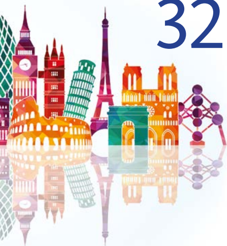
ILLUSTRATION: LISAKOLBASA / ADOBE STOCK