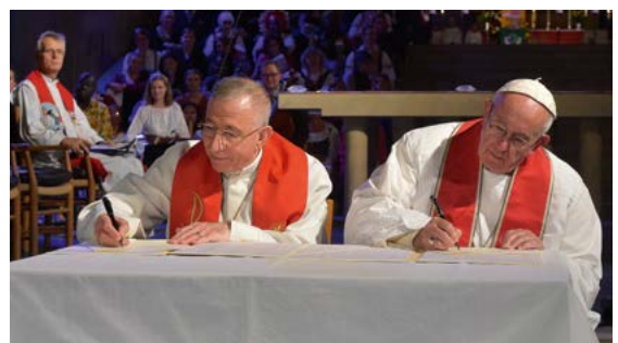
Papst Franziskus und Munib Younan, Präsident des Lutherischen Weltbunds, unterzeichnen die Gemeinsame Erklärung anlässlich des katholisch-lutherischen Reformationsgedenkens in der lutherischen Kathedrale von Lund.

Schon zuvor war man weltweit durch das Dokument „Vom Konflikt zur Gemeinschaft“ (2013) mit großen Erwartungen aufeinander zu gegangen. Als Auftakt des nun gemeinsam ausgerichteten Reformationsjubiläums in Lund (Schweden) am Reformationstag 2016 mit Bischof Younan, dem damaligen Präsident des Lutherischen Weltbundes, und Papst Franziskus eröffneten beide in einem ökumenischen Gottesdienst das Jubiläum auf feierliche Weise. Die gelungene Begegnung wurde durch die gemeinsame Erklärung verstärkt, die beide dabei unterzeichneten. Sie zeigt den klaren Willen zur wachsenden Einheit: „Wir wenden uns an alle lutherischen und katholischen Gemeinden und Gemeinschaften, unerschrocken und schöpferisch, freudig und hoffnungsvoll bezüglich ihres Vorsatzes zu sein, die große Reise,