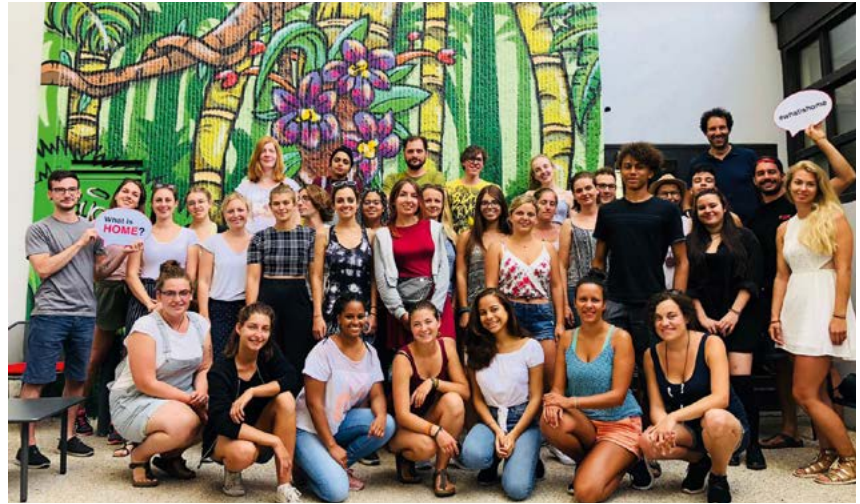
Teilnehmer aus Deutschland, Österreich, Italien, Slowakei, Tschechien und Bulgarien nahmen im Rahmen von MIND an der Summer School in St. Malo teil.

Aus diesem Grund ist eines der 17 Ziele für nachhaltige Entwicklung, die von der UN als politische Zielsetzungen bis zum Jahr 2030 ausgerufen wurden, Maßnahmen zum Klimaschutz zu treffen. Die Bevölkerung über diese Ziele aufzuklären und sie in Verbindung mit Flucht und Migration zu setzen, hat sich das europäische Caritasprojekt MIND (Migration. Interconnectedness. Development) auf die Fahne geschrieben. Gemeinsam mit zwölf Caritas-Orga-