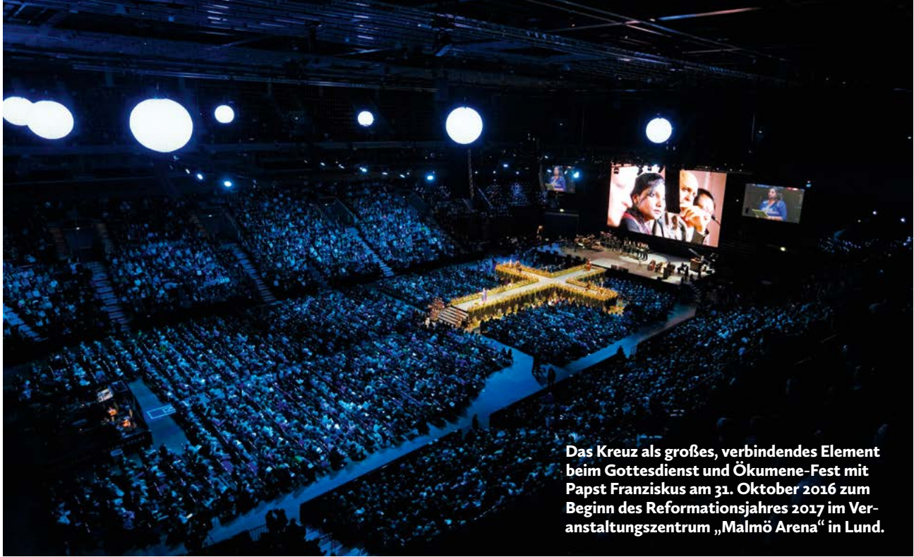
Das Kreuz als großes, verbindendes Element beim Gottesdienst und Ökumene-Fest mit Papst Franziskus am 31. Oktober 2016 zum Beginn des Reformationsjahres 2017 im Veranstaltungszentrum „Malmö Arena“ in Lund.