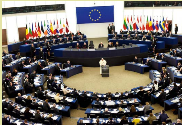
Papst Franziskus besuchte am 25. November 2014 das Europaparlament in Straßburg.

Das Landeskomitee hat bei seiner Mitgliederversammlung im Herbst 2018 einen europäischen Katholikentag bis zum Jahr 2026 gefordert. Eine solche Veranstaltung könne „Ausdruck soliden Brückenbaus sein, der Nationalismus und Populismus überwindet“, heißt es dazu in einer Stellungnahme. Die katholische Kirche als global player könne sich auf diese Weise in den europäischen Einigungsprozess einbringen. Dadurch leiste sie ihren Beitrag, damit Spannungen in Europa abgebaut, nationalistische und populistische Strömungen überwunden, der Wert von Demokratie geschätzt sowie die Prinzipien eines funktionierenden Sozialstaates, nämlich Personalität, Solidarität, Subsidiarität, Gemeinwohl und Nachhaltigkeit in den Vordergrund gerückt werden. Mit einem entsprechenden Antrag wurde das ZdK gebeten, in Kooperation mit der Kommission der Europäischen Bischofskonferenzen (COMECE) und mit den europäischen Partnerorganisationen des katholischen Laienapostolats die konkreten Planungen für einen Europäischen Katholikentag auf den Weg zu bringen. Bei der Frühjahrstagung des ZdK im Mai soll diese Diskussion weitergeführt werden.