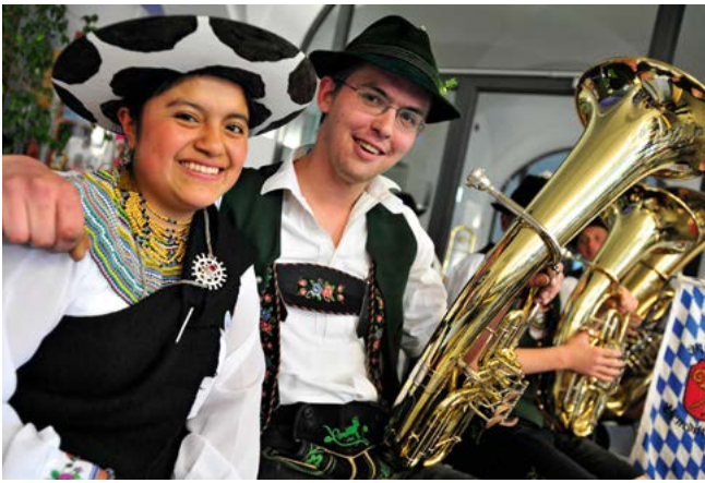
Auch der kulturelle Austausch gehört zur Partnerschaftsarbeit.