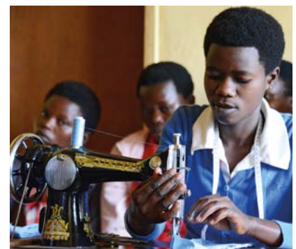
CECUP ermöglicht Frauen eine Ausbildung, zum Beispiel als Schneiderin.

operation auf Augenhöhe, die keinen Geldsack vor Ort ausschüttet, sondern die Eigeninitiative einfordert. Themen wie Globalisierung und Solidarität, welche die cph-Akademie verfolgt, bekommen mit CECUP als eigenständigem Verein eine praktische Dimension für weltkirchliche Verantwortung. Geldspenden sind jederzeit willkommen. Am Nutzen können die Spender über den CECUP-Blog ganz nahe dran sein, indem es dort beispielsweise heißt: „Schweine und Ziegen für 120 Mütter“.