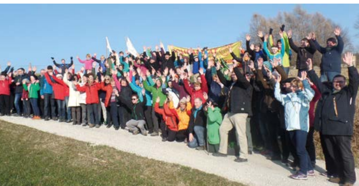
Mehr als hundert Personen nehmen jedes Jahr am Hungermarsch im Dekanat Viechtach teil.

Der jüngste Mitwirkende bisher wurde mit drei Monaten im Kinderwagen mitgefahren und die Mama hat für ihn brav einen Spendenbeitrag abgegeben, der älteste ist jedes Jahr weit über 80 Jahre alt. Auch Familien mit Kindern, junge Firmbewerber oder kleine Vereinsabordnungen schließen sich jedes Jahr an. So hat der Hungermarsch bei uns nicht nur den ärmsten Menschen über Spendenprojekte weltweit geholfen, sondern auch die Gemeinschaft und Zusammenarbeit der Missionsinteressierten in den Pfarreien des Dekanates Viechtach spürbar zusammengeschweißt. Kein Wunder, dass dieser Arbeitskreis auch regelmäßig Gäste aus der Weltkirche einlädt und wirkungsvolle Bewusstseinsbildung in der Armutproblematik schafft.