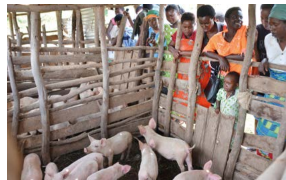
Neben Bildungsprojekten setzt CECUP auch auf Landwirtschaft: Beim Jungtier-Projekt erhalten Frauen Ferkel oder junge Ziegen als Starthilfe.

Neu ist das Jungtier-Projekt, hier werden Frauen mit Ferkeln oder Jungziegen als Starthilfe unterstützt. Das Tier muss artgerecht gehalten werden und soll – sobald es aufgewachsen ist – verkauft werden. Der Erlös dient der Anschaffung eines neuen Jungtiers zur Aufzucht. Mit dem verbleibenden Gewinn soll Schulausrüstung für die Kinder erworben werden. CECUP ist eine Ko-