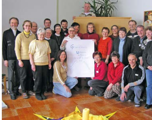
Das Globalisierung und Welthandel standen im Zentrum des Kurses im Jahr 2005 in Mellatz.