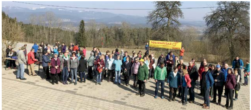
Pause darf auch mal sein: Beim Hungermarsch gibt es immer verschiedene Stationen: Andachten, Grußworte und natürlich eine Brotzeit.

So sind wir heuer am Misereorsonntag bereits zum 22. Mal mit knapp 100 Teilnehmern aus 17 unterschiedlichen Pfarreien aufgebrochen, um die etwa zehn Kilometer lange Strecke in guter Gemeinschaft zu bewältigen und unterwegs an vier Stationen interessante Informationen zur Fastenaktion, zum Hungertuch, zum Hilfswerk Misereor und zum ausgewählten Förderprojekt zu bekommen. Dabei ist das Prinzip dieses Hilfsprojektes ganz einfach und spricht wohl deshalb auch so viele Menschen an. Unser Arbeitskreis Mission-Entwicklung-Frieden-Bewahrung der Schöpfung (MEF'S) auf Dekanatsebene wählt jedes Jahr eine idyllische Wanderstrecke zwischen zwei Pfarrstellen aus und versucht dort Mitarbeiter für die einstimmende Andacht am Start, eine Brotzeitstation mit fair gehandelten Köstlichkeiten unterwegs und eine Dankandacht am Ziel zu gewinnen. Bereits im Vorfeld suchen die