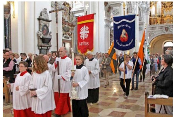
Viele Gruppen und Verbände kamen mit ihren Fahnenabordnungen zum Jubiläumsgottesdienst.

Nach dem Wegfall der Begeisterungswelle des Konzils seien viele als Einzelkämpfer oder mit nur wenigen