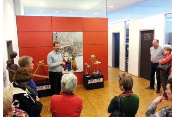
Die Gruppen arbeiten immer an bestimmten Schwerpunkten und richten auch ihre Exkursionen danach aus. Hier gab es eine Führung durch die Räume des Kindermissionswerks „Die Sternsinger“.