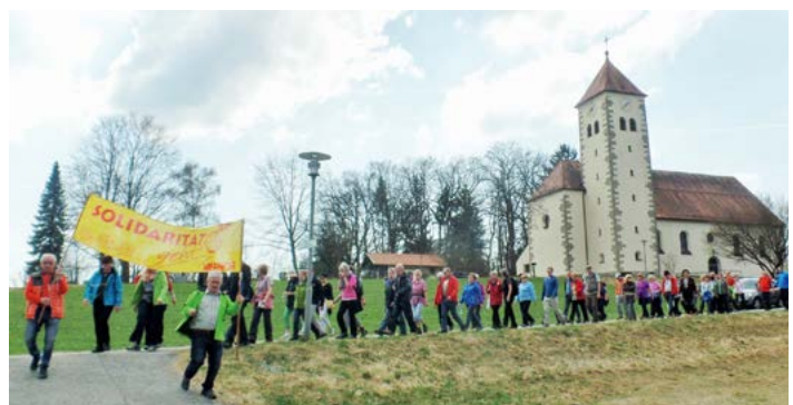
„Solidarität geht weiter“ – dieses Banner tragen die Teilnehmer des Hungermarsches im Dekanat Viechtach jedes Jahr gut sichtbar voran.