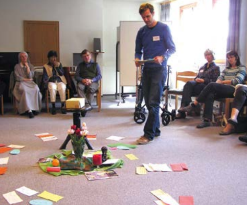
Bei „global prayer – global player. Weltkirche Kompakt“ legen die Teilnehmer selbst ihre Schwerpunkte fest.