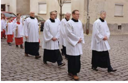
Beim Pastoralbesuch von Bischof Rudolf Vorderholzer gingen die erwachsenen Ministranten beim Kirchenzug vor den jungen Messdienern.