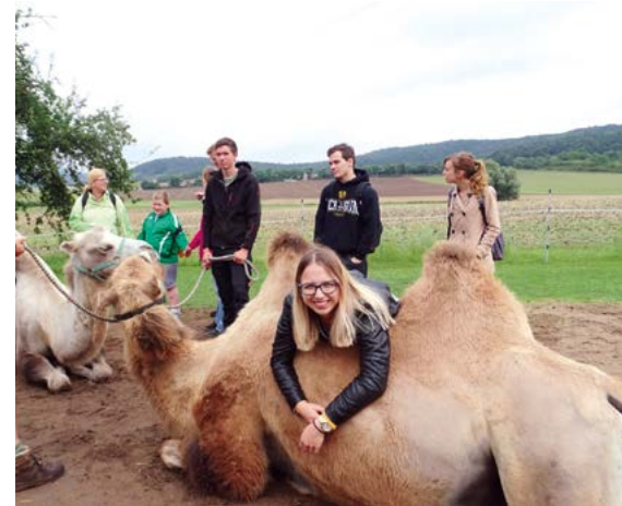
Gemeinsam mit der Lebenshilfe Ebern ging die I have a dream Group auf Lama-Tour.

Im Juni 2014 fand das bundesweite Fußballturnier „Tore für Toleranz“ statt. Damit hat man sich gegen Rechtsextremismus, Intoleranz und Fremdenfeindlichkeit stark gemacht. Auch an der 72-Stunden-Aktion des BDKJ hat man sich beteiligt: Es wurde ein Spielplatz in Zusammenarbeit mit einigen Asylbewerbern restauriert und um zusätzliche Spielgeräte erweitert. Weiterhin hat die IHADG mit dem Projekt „Dem Ehrenamt ein Gesicht geben“ einen Kurzfilm über die Bedeutung des ehrenamtlichen Engagements gedreht, in dem sie diverse Ehrenamtliche in ihrem Landkreis mit der Kamera begleitet