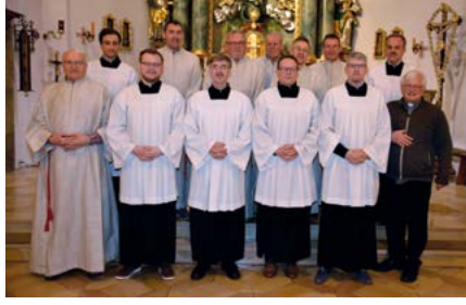
Die erwachsenen Ministranten der Pfarrei Mariä Himmelfahrt Rieden: Ursprünglich haben sie Alben getragen, inzwischen tragen sie schwarze Talare und weiße Chorhemden.