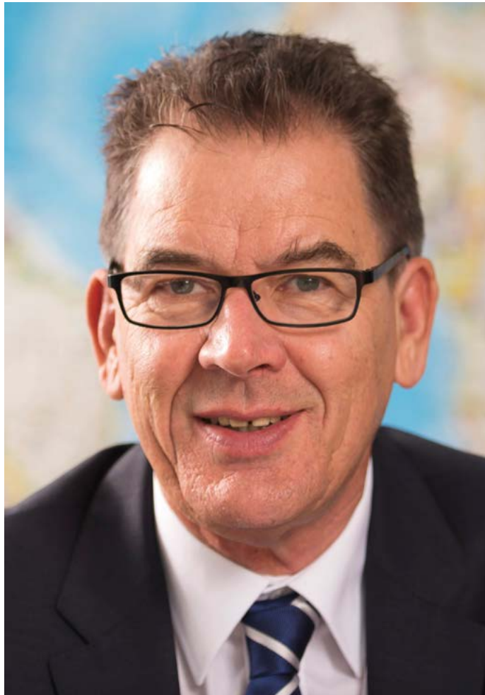
Bundesentwicklungsminister Dr. Gerd Müller schätzt die Arbeit, die kirchliche Organisationen und deren Partner vor Ort leisten.

Wir alle müssen Nachhaltigkeit zu einem zentralen Prinzip unseres Handelns machen. Denn was wir tun, hat Folgen für andere: für ande-