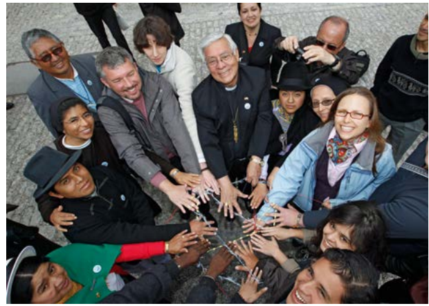
Weltkirche erleben, mit einer gesunden Partnerschaft.

Zusammenleben“ und brauchen gute Ohren und ein waches Herz, um diese uns fremde Denkweise nachzuspüren. Gelingt dies, dann versteht man wohl eher, was im Johannes-evangelium steht, wenn Christus uns ein Leben in Fülle verheißt. Mit viel Phantasie sind in den zurückliegenden Jahrzehnten Teilchenelemente entwickelt worden, die ein Erfühlen eines Miteinanders auf Augenhöhe erfahrbar machen.