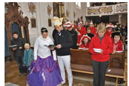
Der gesamte Hofstaat mit dem Prinzenpaar an der Spitze feiert den Gottesdienst mit.