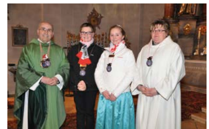
Pfarrer und Lektorin bekamen vom Kinderprinzenpaar den Jahresorden.

Gut gestaltete Faschingsgottesdienste – inhaltlich, musikalisch, konzeptionell – bieten die Chance, dass Jung und Alt die Kirche, konkret die Messfeier, positiv erleben und die Frohe Botschaft auch fröhlich und mit Freude verkündet und weitergegeben wird.