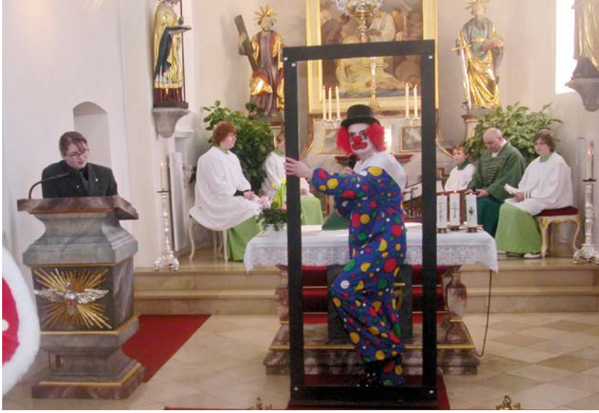
Der Clown, der aus dem Rahmen fällt und diesen dann zum Kreuz umbaut.