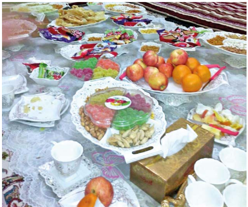
Das Ende des Ramadan wird mit einem großen Fest im Rahmen von Familie und Freunden gefeiert. Beim „Fastenbrechen“ kommen drei Tage lang festliche Gerichte, Süßigkeiten und Geschenke auf den Tisch.

Viele bezeichnen das Fastenbrechen als das Weihnachten der Muslime, denn es ist – wie Weihnachten bei den Christen – ein familiäres Fest. Beide Feste sind sich in vielen ihrer Bräuche erstaunlich ähnlich und weisen trotz der Unterschiede in der religiösen Bedeutung einige Parallelen auf: Auch für das Fest des Fastenbrechens spielen das Beschenken der Kinder und Süßigkeiten eine wichtige Rolle. Man sitzt lange zusammen, redet und der Tisch ist immer voll mit Essen. Für Muslime ist das ein besonderes Ereignis. Sie freuen sich auf das Fastenbrechen wie die Christen sich auf das Weihnachtsfest freuen.