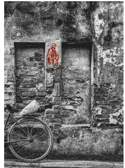
GRAFIK: ÖKUMENISCHER KREUZWEG DER JUGEND 2018

Möglichkeit gibt, für das Gebet mit der eigenen Gruppe einen schon fertig konzipierten Weg zu nutzen oder ihn für sich anzupassen. Die zweite App-Variante, die Single Prayer App, kann während des ganzen Jahres verwendet werden. Bilder, Texte und Musik des Kreuzwegs geben Orientierung für das persönliche Gebet und die Möglichkeit, einfach nur zu