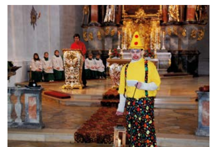
Der Clown, der mit seiner Laterne nach der wahren Freude sucht.