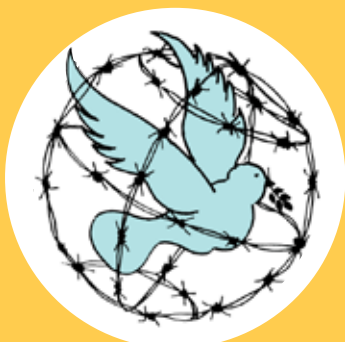
ILLUSTRATION: ARBEITSKREIS SHALOM

Seit dem Jahr 1982 verleiht der Arbeitskreis Shalom für Gerechtigkeit und Frieden an der Katholischen Universität Eichstätt-Ingolstadt den Friedenspreis an herausragende Persönlichkeiten, die sich für Frieden und Menschenrechte einsetzen. Er wird über Spenden finanziert. Der Shalompreis ist einer der höchstdotierten Menschenrechtspreise Deutschlands. In den letzten Jahren kamen je Preisträger zumeist mehr als 20.000 Euro zusammen. (alx)