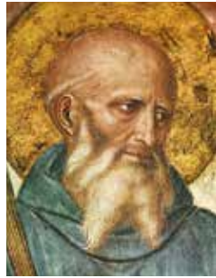
Weiter aktuell: Die Regeln des Heiligen Benedikt von Nursia

Handfeste Arbeit und praktische Fertigkeiten, in vielen Bereichen der Arbeitswelt gehört das der Vergangenheit an. Arbeit wird zunehmend immateriell: Es geht um Planen, Organisieren, Beraten, Probleme durchdenken, Recherchieren und schließlich darum, das zusammengetragene Wissen zu strukturieren, eigene Schlüsse daraus zu ziehen und wiederum für andere aufzubereiten. Wir sind angekommen in einer Wissensgesellschaft. Tagtäglich sind wir an unserem Arbeitsplatz umgeben von Informationen, Zahlen, Daten, Fakten. Diese „Flut“ alleine zu bewältigen, erscheint schier unmöglich, da der Berg an Informationen über den Tag hinweg weiter anschwillt. Wir sind also auf die Kompetenzen, Urteile und Mitarbeit anderer