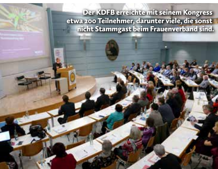
Der KDFB erreichte mit seinem Kongress etwa 200 Teilnehmer, darunter viele, die sonst nicht Stammgast beim Frauenverband sind.

* Mehr zum Thema im Internet: www.gemeinde-creativ.de