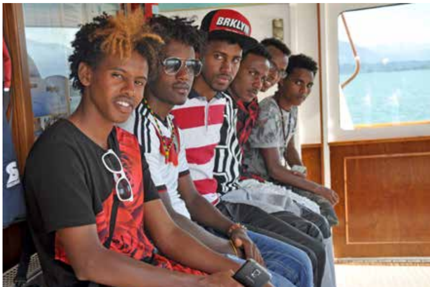
Im Salesianum werden unbegleitete minderjährige Flüchtlinge betreut.