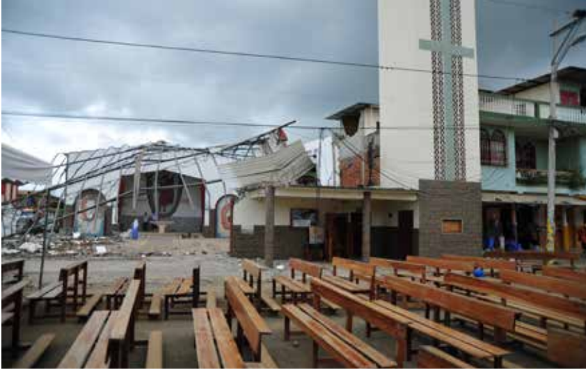
Eine Kirche ohne Außenwand, Kirchenbänke, die plötzlich im Freien stehen. Es wird noch dauern, bis die Menschen hier wieder wie früher Gottesdienst feiern können.