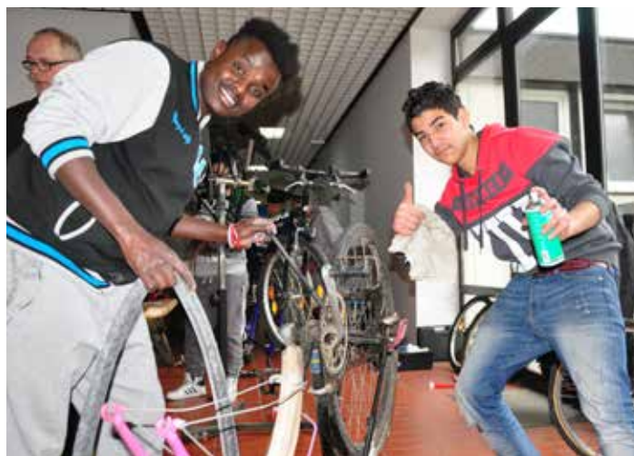
Im Salesianum lernen die jungen Flüchtlinge auch ganz praktische Dinge, beispielsweise wie man ein Fahrrad repariert.

Die Entwicklungen des vergangenen Jahres haben wir durch die Kontakte unserer Jugendlichen in ihre Heimatländer schon lange kommen sehen, als noch vielerorts die Augen verschlossen wurden. Genauso sehen wir aber auch jetzt Chancen, die eine bereitwillige Integration von Flüchtlingen künftig bieten kann. Der zwischenmenschliche Gewinn ist genauso groß, wie die wirtschaftliche Arbeitskraft, die junge, motivierte Menschen mitbringen, die wissen, dass sie sich hier ein Zuhause auf unbestimmte Zeit aufbauen müssen und dürfen.