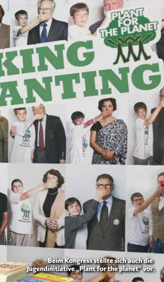
Beim Kongress stellte sich auch die Jugendinitiative „Plant for the planet“ vor.

heute wissen, ob sie mit ihrer Geldanlage Kinderarbeit, Ausbeutung oder Umweltzerstörung mit finanzieren. Immer mehr große Anleger würden sich bewusst aus unökologischen und ethisch fragwürdigen Investitionen zurückziehen. Beispielsweise wolle der Allianz-Konzern nicht mehr in Kohlekraftwerke investieren, sondern vermehrt in erneuerbare Energien. Gerd Müller ist überzeugt: „Nachhaltigkeit wird Standard werden, auch bei den Investitionen.“