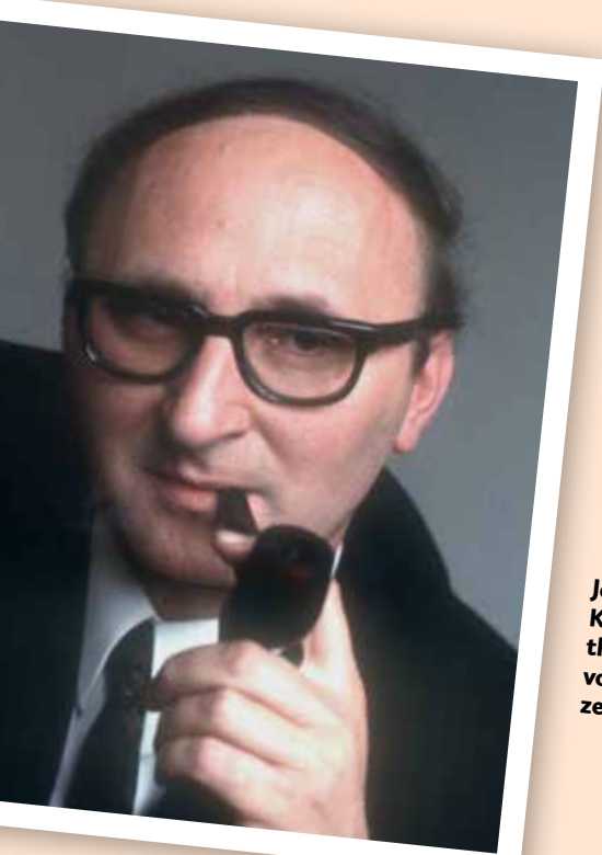
Johann Baptist Metz: Katholischer Fundamentaltheologe und Schüler von Karl Rahner. Das Foto zeigt ihn im Jahr 1971.