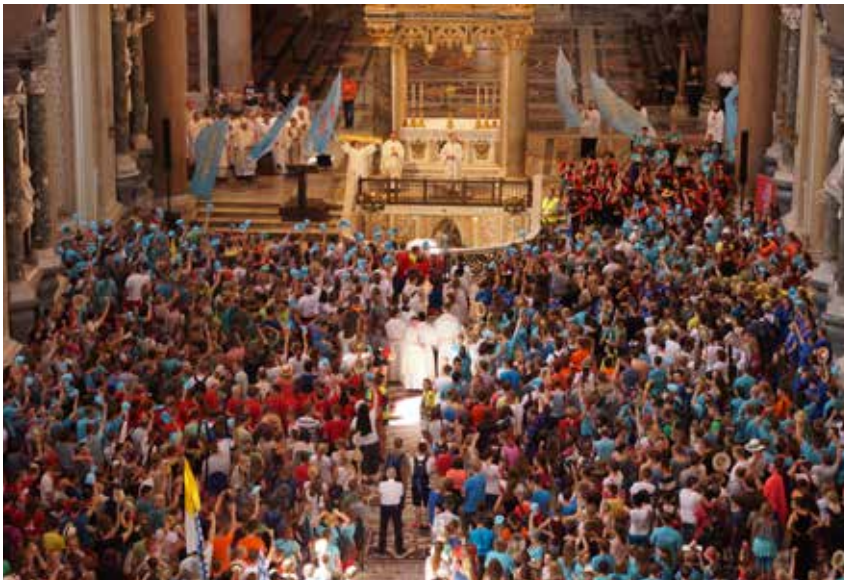
Minis in Rom: Die Gemeinschaft zählt. 2015 trafen sich bei der internationalen Ministrantenwallfahrt etwa 4.000 „Minis“ in Rom.