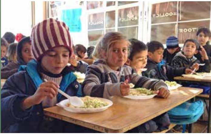
Misereor unterstützt mit den Spenden beispielsweise Menschen in den Flüchtlingslagern im Libanon und Nordirak.