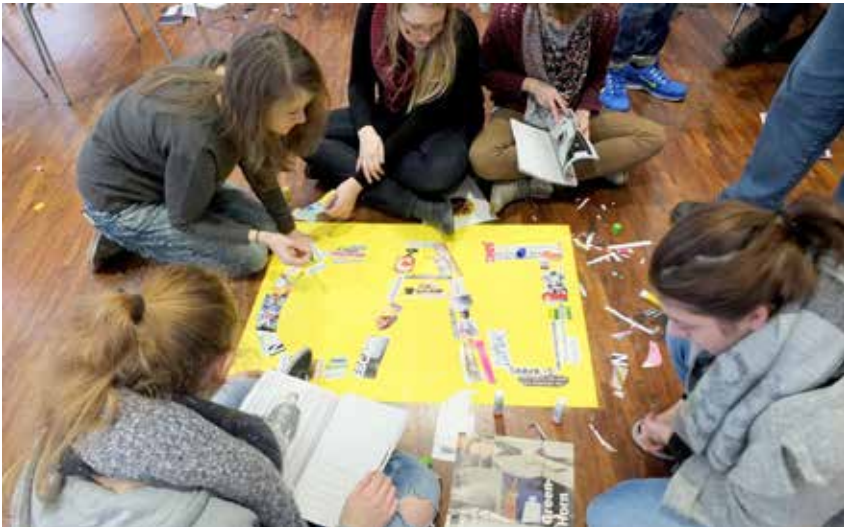
Die CAJ Würzburg setzt ihre Themen auf verschiedene Weisen um – mal in Form eines Glaubensgesprächs, mal mit Kleber, Schere und Papier.