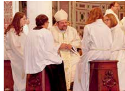
Münchens Weihbischof Wolfgang Bishof nimmt sich immer wieder Zeit, mit Minis ins Gespräch zu kommen.